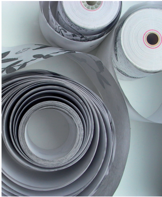
Maria Bussmann Kassazettelrollen (cash register rolls) 2009 Bleistift auf Papier © M.Bussmann 2009

Kontakt: Annelies Senfter | anneliessenfter@galerie-altnoeder.com , | T. +43 664 73835164