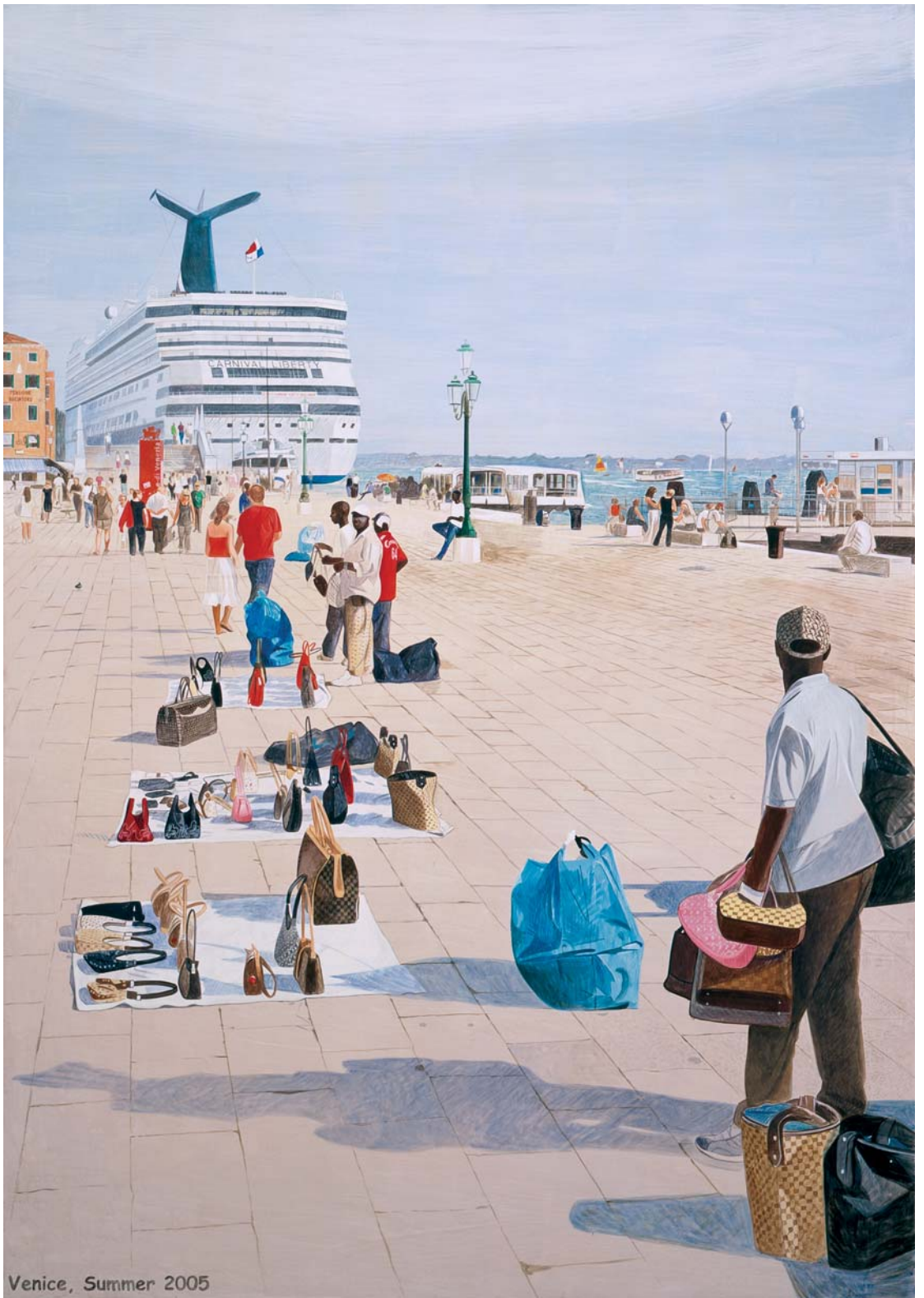
Venice, Summer 2005